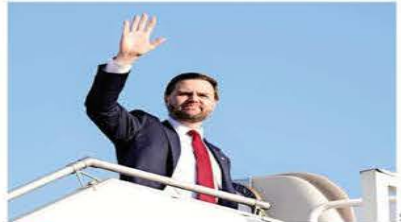
SE VA. El Vicepresidente de EU, JD Vance, saluda al abordar el Air Force Two para dejar Pakistán, tras participar en las conversaciones con Irán en Islamabad.

La refinería de Ciudad Madero, en Tamaulipas, tuvo su último incidente grave hace 9 años: una emanación de ácido sulfhídrico dejó un muerto y 3 intoxicados, mientras que en la planta de Salamanca, Guanajuato, se registró un incendio en el año 2024, pero no provocó víctimas.