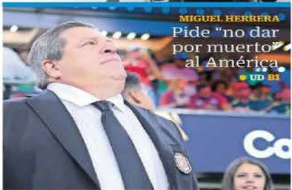
MIGUEL HERRERA Pide "no dar por muerto" al América ● UD E1