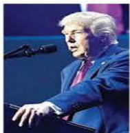
Trump encabezó ayer un mitin en Arizona.