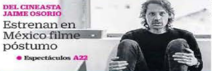
DEL CINEASTA JAIME OSORIO Estrenan en México filme póstumo ● Espectáculos A22