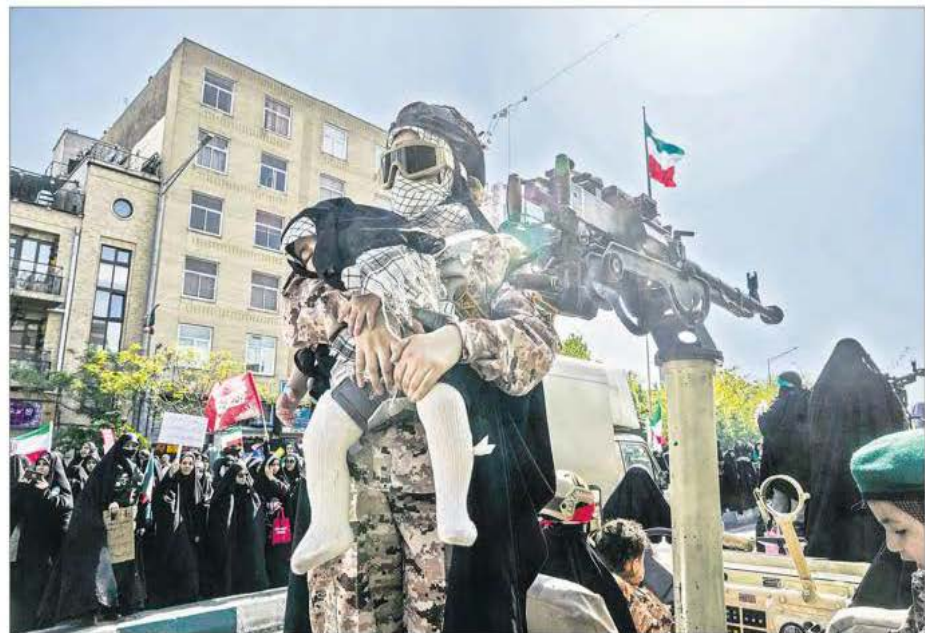
▲ En medio de la incertidumbre, Pakistán, país mediador, intenta conseguir una nueva ronda de negociaciones entre Estados Unidos e Irán. En la imagen, una integrante del grupo paramilitar voluntario