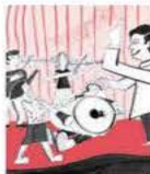
Ilustración: Emmanuel Peña

Lo sobrenatural y la incertidumbre frente a lo desconocido son dos de los temores que abordan cinco estudiantes en el libro Con motivo del miedo . / 22