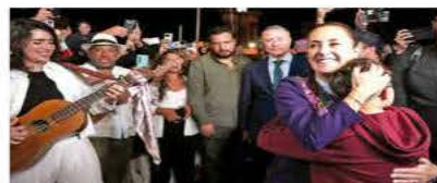
RECIBEN A SHEINBAUM CON JUBILO