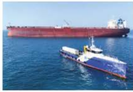
UN BUQUE con bandera de Malta, ayer, por el estrecho de Ormuz.