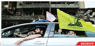
PROHIBE EU A ISRAEL ATACAR LÍBANO Mientras algunos libaneses celebran el alto al fuego y otros, desplazados por la guerra, regresan a sus hogares, el Presidente Donald Trump aseguró que ordenó a Israel dejar de bombardear Líbano, usando un tono inusualmente duro con su aliado histórico.