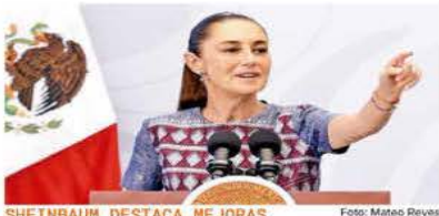
SHEINBAUM DESTACA MEJORAS