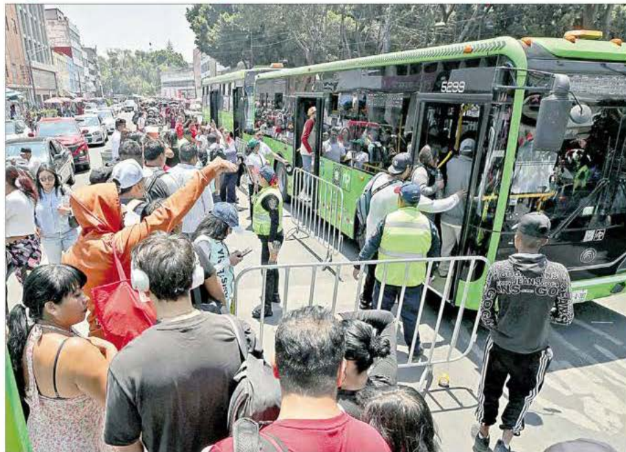
▲ Usuarios padecieron ayer un día caótico por cierres parciales en el Metrobús debido a movilizaciones por el primero de mayo y en la línea 2 del Metro por las labores de remodelación. Con motivo de la suspensión del servicio entre Pino Suárez (en la imagen) y Xola