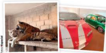
ANIMALES exóticos y autos decomisados, ayer.

EU da por "terminadas" las hostilidades con Irán, con sus fuerzas aun apuntadas contra ese país; la guerra aún no se da por concluida. págs. 12 y 13