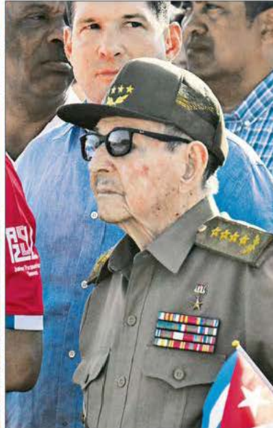
▲ La celebración por el Día del Trabajo se realizó frente a la embajada estadounidense, en la explanada denominada Tribuna Antimperialista, en lugar de la Plaza de la Revolución, donde siempre se ha llevado a cabo, y con la consigna "la patria se