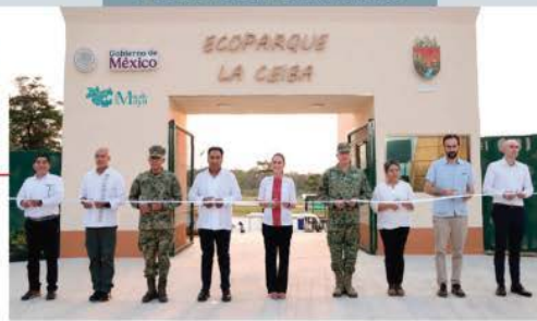
LA MANDATARIA inaugura el Ecoparque La Ceiba en Palenque, Chiapas, ayer.

LÍDERES sindicales reconocen avances laborales, pero demandan una reforma fiscal para que aguiñado y horas extra exenten impuestos. págs. 4 y 6