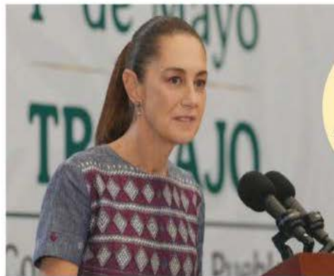
↑ Primavera laboral

No obstante, destacó que esta posibilidad de detención constituye a una restricción a los Derechos Humanos, por lo que esta medida cautelar sólo puede ser otorgada si existen motivos, fundamentos y sufi-