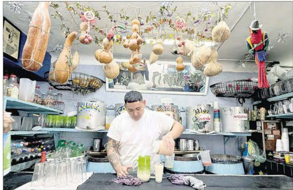
▲ En esta colonia ubicada en la alcaldía Miguel Hidalgo confluyen cafés, parques, bibliotecas, cantinas, mercado, edificios históricos y calles estrechas. Su nombre se deriva de la familia Escandón, que en 1869 adquirió los terrenos y fue ejemplo del desarrollo inmobiliario de la época, pero ahora los residentes luchan por evitar que la llamen Nueva Condesa. Foto Yazmín Ortega Cortés KEVIN RUIZ / P 25