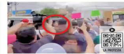
Maestros buscaron abordar a la Presidenta en la camioneta donde viajaba con la Gobernadora Tere Jiménez.

Paseo de la Reforma se llenó ayer de color durante el Gran Desfile Mundialista. Globos, comparsas, catrinas y carros alegóricos alusivos al torneo partieron de la Glorieta de la Diana y llegaron al Monumento a la Revolución, entre la efervescencia futbolera de los asistentes. CIUDAD 6