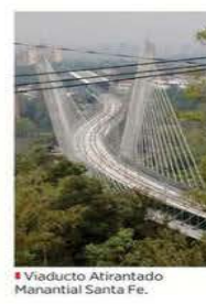
Viaducto Atriantado Manantial Santa Fe.

VICTOR FUENTES Vigilar el comportamiento del Viaducto Atriantado Manantial Santa Fe, la obra que se tuvo que diseñar en el sexenio pasado para concretar el recorrido del Tren Interoceánico México-Toluca, ahora conocido como El Insurgente, costará al Gobierno federal 113 millones de pesos. Si bien el tramo Santa Fe-Observatorio apenas empezó a funcionar el 2 de febrero, la Agencia de Trenes y Transporte Público Integrado adjudicó un contrato para verificar el comportamiento estructural y garantizar la seguridad del viaducto de 515 metros de largo, que tiene un claro de hasta 200 metros de altura. La empresa Camde Ingenieros ganó el 2 de junio el contrato para la verificación estructural durante seis meses, luego de un proceso de invitación restringida a tres empresas. La construcción del viaducto, a cargo de la empresa ICA, costó unos mil 332 millones de pesos, es decir, la vigilancia aumentará un 8.4 por ciento lo invertido en la obra. El viaducto, producto de un cambio de trazo del tren ante protestas de habitantes del pueblo de Santa Fe contra la ruta original, fue diseñado para no afectar los veneros del manantial. La Agencia explicó que el sistema integral de revisión permitirá detectar deformaciones que puedan comprometer la infraestructura.