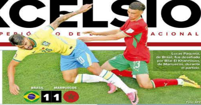
Lucas Paqueta, de Brasil, fue desafiado por Bilal El Khannoussi, de Marruecos, durante el partido.