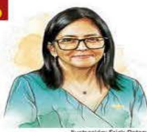
Ilustración: Erick Retana

A seis meses de caer Maduro, Delcy Rodríguez, presidenta de Venezuela, purga al chavismo, pacta con Trump y entrega cabezas a EU. / 17